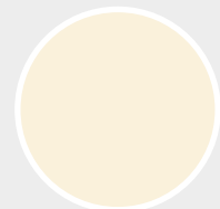
Blanc crème RAL 9001