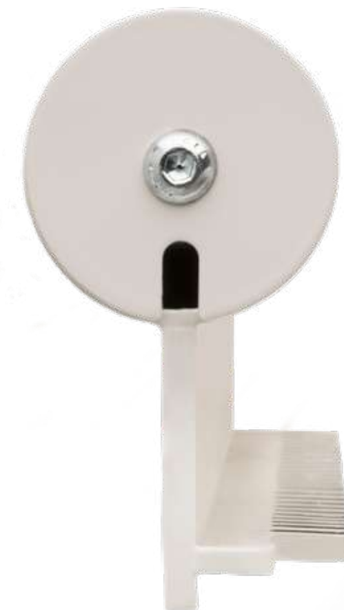
Otolift Modul-Air Smart

Le rail modulaire est tellement solide que nous l'avons charge jusqu'a 8 00 kg pendant les essais. Telle est la qualite Otolift.